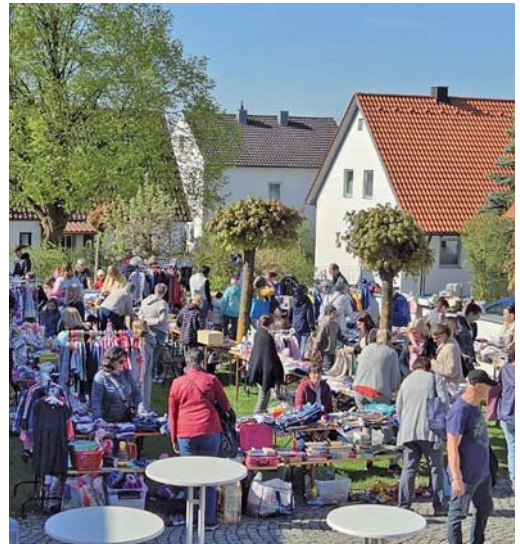
Kinderflohmart am 25. April

Verwenden Sie dazu gern unser Spendenkonto: Evang.-Luth. KG Gaimersheim Raiffeisenbank im Donautal eG IBAN: DE20 7216 9812 0000 0560 30