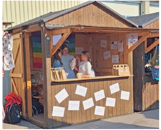
Der Stand unserer Jugend auf dem Gaimersheimer Volksfest

■ Veranstaltungen des Evangelischen Forums Ingolstadt finden Sie unter www.evangelisches-forum-ingolstadt.de/