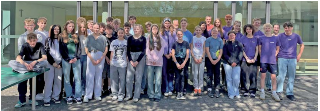
Konfirmandenfreizeit zusammen mit Friedrichshofen in Pfünz vom 24. bis 26. April.

Am Sonntag, den 21. Juni werden die „Konfis“ den Gottesdienst selbst gestalten; sie werden dabei kräftig unterstützt von unserer Jugendprojektband. Und sie freuen sich auf Viele, die den Gottesdienst mitfeiern!