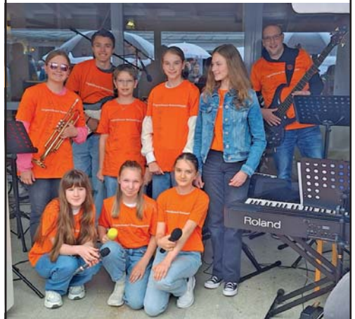
Die Jugendprojektband beim Gemeindefest am 14. Mai