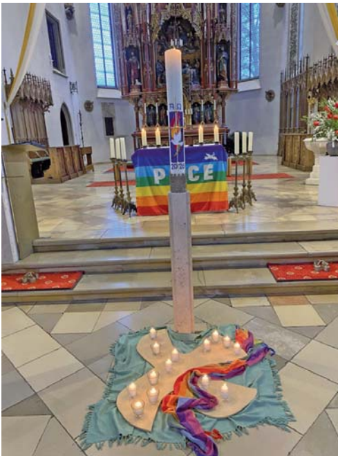
Ökumenisches Friedensgebet am 17. April