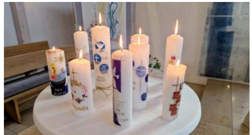
Tauferinnerung am 12. April

Außerdem freuen wir uns sehr, wenn Sie die Begegnung mit unseren Gästen auch durch Spenden zu unterstützen. Verwenden Sie dazu gern unser Spendenkonto: Evang.-Luth. KG Gaimersheim Raiffeisenbank im Donautal eG IBAN: DE20 7216 9812 0000 0560 30