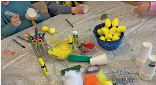
Osterbasteln für Grundschulkinder am 20. März

Unser AK Tansania hat in Kooperation mit dem Partnerschaftskomitee in Kilakala das Programm zusammengestellt: dabei geht es natürlich zum einen um die Begegnung mit der Gemeinde bei Gottesdiensten, Treffen und Essen und mit einzelnen Gemeindegruppen und –aktivitäten. Aber auch um das gemeinsame Kennenlernen des Umgangs von Kirche und Gesellschaft mit Personen, die besondere Bedürfnisse haben: Menschen mit Einschränkungen, mit Krankheit u.ä. Dazu werden wir mit den Gästen sowohl verschiedene Einrichtungen besuchen als auch uns zu diesem Thema austauschen und voneinander lernen.